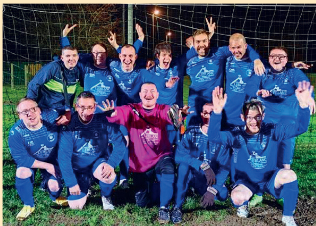
1 er plateau de notre équipe en novembre 2023

Les résidents de Nogent sont véhiculés et accompagnés par un de leurs éducateurs à chaque séance d'entraînement du mercredi soir et des plateaux sont organisés mensuellement pour permettre des rencontres entre les différentes sections du département, ce qui se traduit souvent par de chaleureuses retrouvailles entre les participants, tout à leur joie de se revoir et de porter haut les couleurs de leurs clubs respectifs.