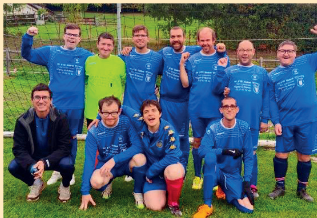
1 er plateau de la saison 2025-2026

Pour notre 3 ème année de participation en cette saison 2025-2026 ce ne sont pas moins de 9 sections ornaises qui se retrouvent mensuellement aux 4 coins du département. Le stade Jacques SABRAS accueillera d'ailleurs un plateau le jeudi 05 mars 2026 à partir de 19h . Venez nombreux encourager nos bleus !